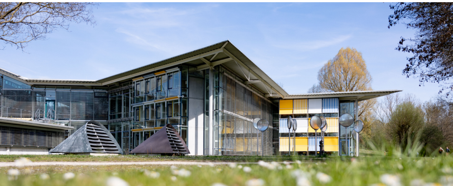
Stand: Mai 2023