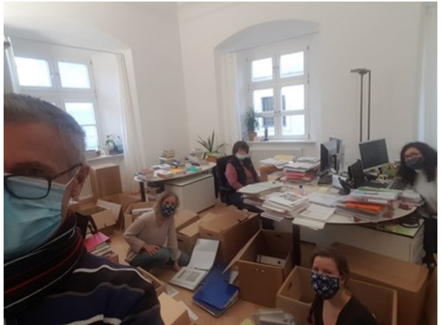
Foto: Actividad de clasificación en el ZILAS