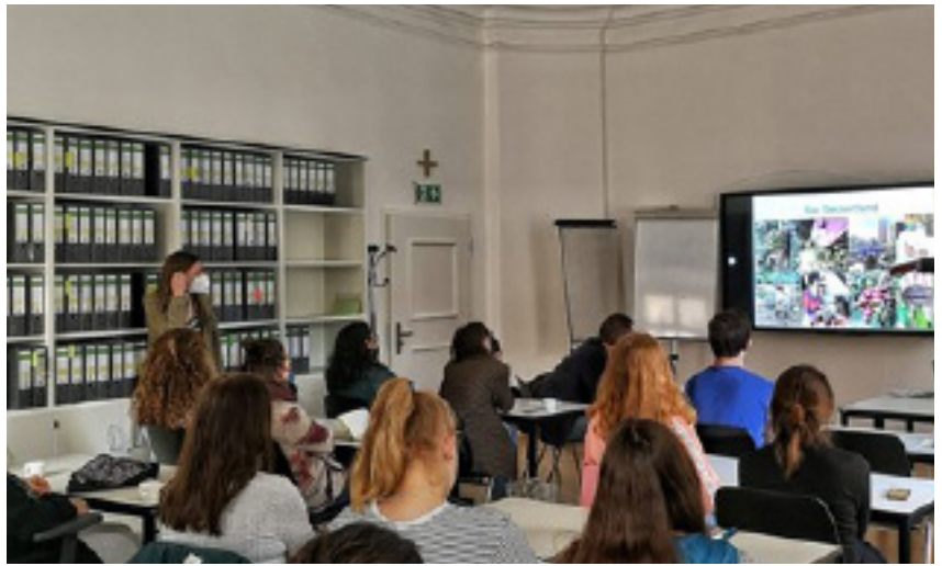
Foto: La sala llena durante el ciclo “América Latina en movimiento”.

El ciclo de conferencias concluyó con la presentación de la conferencia “América Latina: el territorio como cuerpo en movimiento”, a cargo del Prof. Dr. Fernando Resende, de la Universidade Fede-