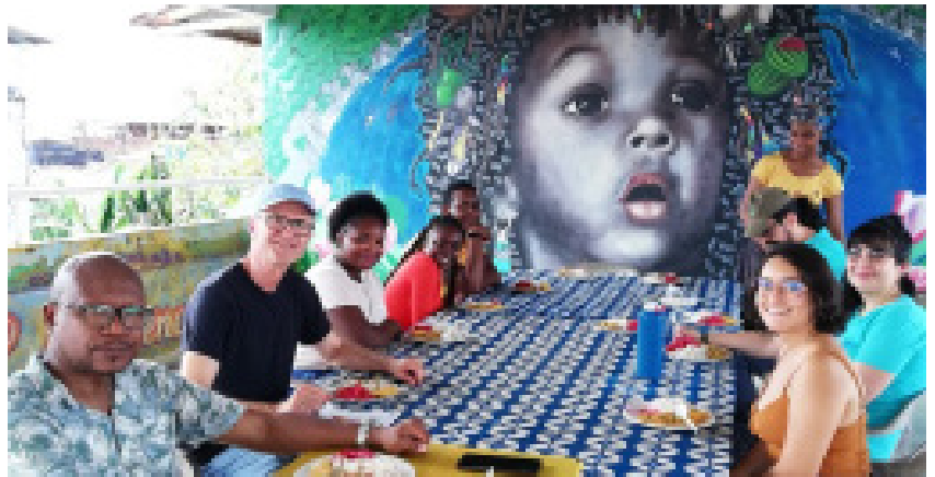
Foto: Merienda con los participantes de un taller en el Centro de Memoria de Buenaventura.