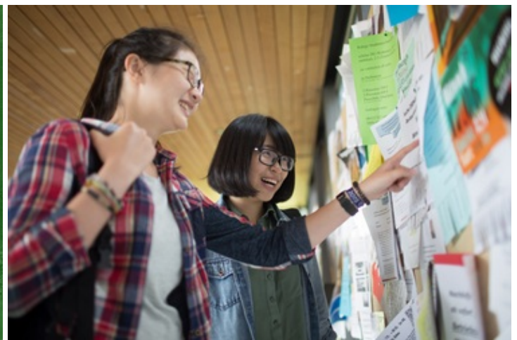
Internships in Germany