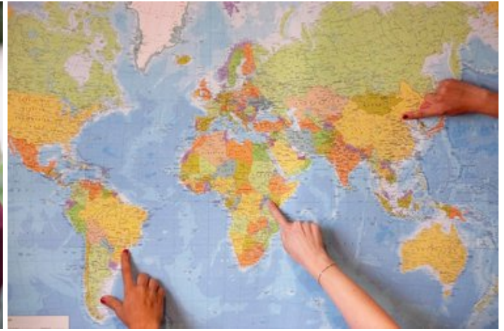
Tipps für Auslandsaufenthalte im Rahmen von Praktika