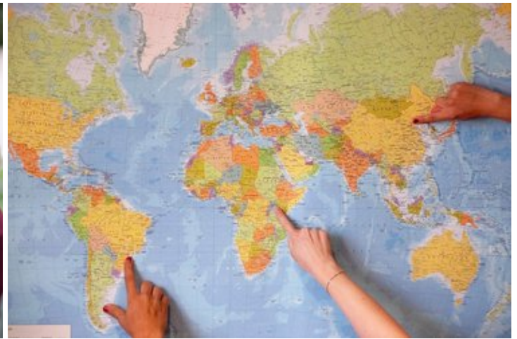
Tipps für Auslandsaufenthalte im Rahmen von Praktika