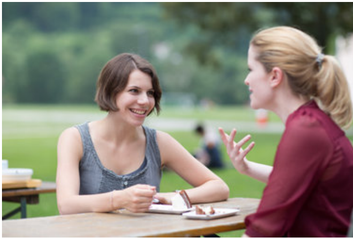
Erfahrungsberichte & Praktikumsangebote