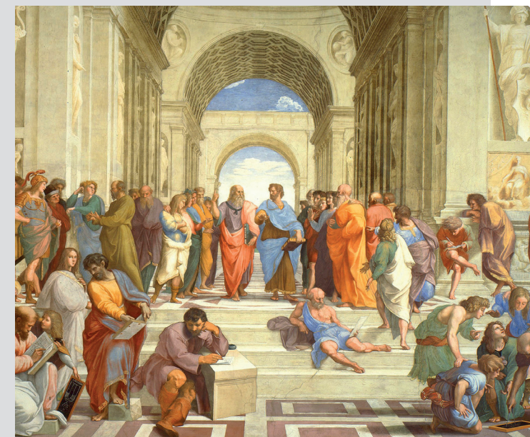
Titelbild: Raffael – Die Schule von Athen (1511). Das Fresco zeigt die wichtigsten Philosophenschulen des antiken Griechenlands, im Zentrum Platon und Aristoteles.