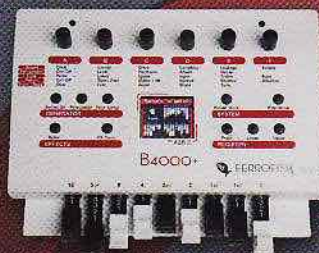
Ferrofisch B4000+ Drawbarmodul Überzeugende Westentaschen-B3 ▼