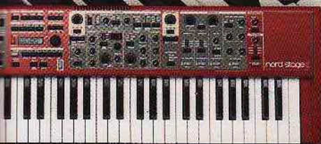
◀ Nord Stage 2 Das ultimative Bühnen-Keyboard?