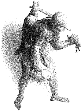
Ein römischer Bauer geht mit einem Hasen und einem Korb mit Früchten zum Markt. Detail eines römischen Reliefs. München, Glyptothek