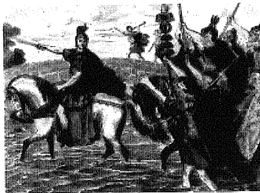
Caesar überschreitet den Fluss Rubikon. Illustration. 19. Jh. Bestimme die Stelle von T, zu der die Illustration am besten passt, und begründe deine Zuordnung. Lege ggf. dem reitenden Caesar einen passenden lateinischen Satz in den Mund.