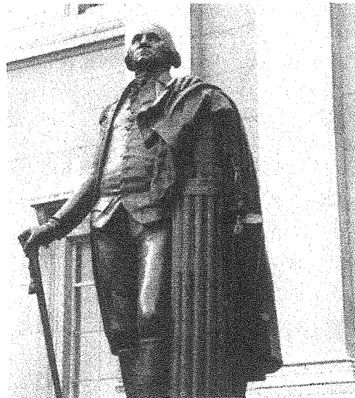
Statue von George Washington (1732–1799) in Trafalgar Square, London