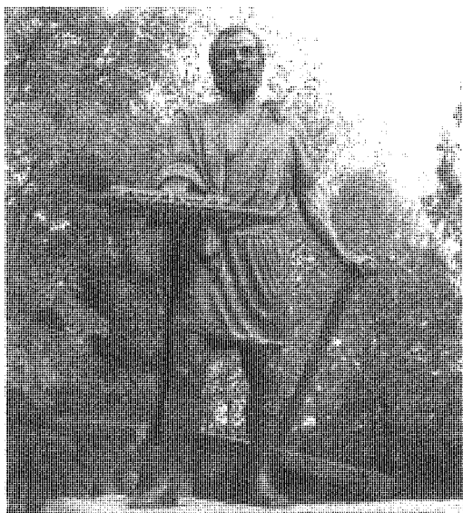
Cincinnatus-Statue im Eden Park, Cincinnati