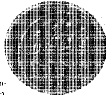
Römische Münze (60 v. Chr.)

Eine neue Zeit fängt an. Der letzte König Roms, Tarquinius Superbus, errichtete wichtige öffentliche ( pūblicus, -a, -um ) Bauwerke. Dazu zählt der Jupitertempel auf dem Kapitol, aber auch die Cloaca Maxima, ein Kanal, der das sumpfige Tal zwischen Kapitol und Palatin entwässerte: Erst dieser Kanal ermöglichte es, dass das Gebiet später ( postea ) als Forum genutzt werden konnte. Tarquinius war aber auch ein selbstherrlicher Alleinherrscher: Er wollte nicht nur den Staat lenken ( regere, -ō ), sondern fand es richtig, jeden selbstbewussten Bürger ( civis, -is ) rücksichtslos zu unterdrücken ( opprimere, -ō ). Die römischen Adelligen empfanden das zunehmend als Knechtschaft ( servitūs, -ūtis ), die sie sich nicht mehr gefallen lassen wollten. Im Jahr 509 v. Chr. konnten sie Tarquinius unter der Führung des L. Iunius Brutus (der Beiname „Brutus“ bedeutet „Dummkopf“) schließlich vertreiben ( pellere, -ō ).