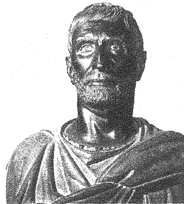
Büste des Brutus. Etruskisch, 4./3. Jh. v. Chr.

„Priusquam de re publica dicam, civēs, pauca verba faciam de me: Saepe a vobis reprehendor vel rideor, quia stulta vel dixi vel feci. Vos fallēbam: Me stultum enim esse fingēbam, quia credēbam ita me servari ab 5 insidiis regis. Ego non sum stultus. Immo vos stultos esse putō: Sinitis 1 vos a superbō dominō regi: Claudimini, torquēmini, necāmini! Lēgēs tolluntur, mōrēs perduntur. Tū, Rōma, nōn a rēge regeris, sed a sceleratō! Nōne vos, civēs, memoriā tenētis deōs 10 quondam nobis prōmississe: ‚Eritis dominī omnis ferē orbis terrarum!‘ Adhūc nē urbs nostra quidem a nobis regitur! Immo opprimimur velut servi!“