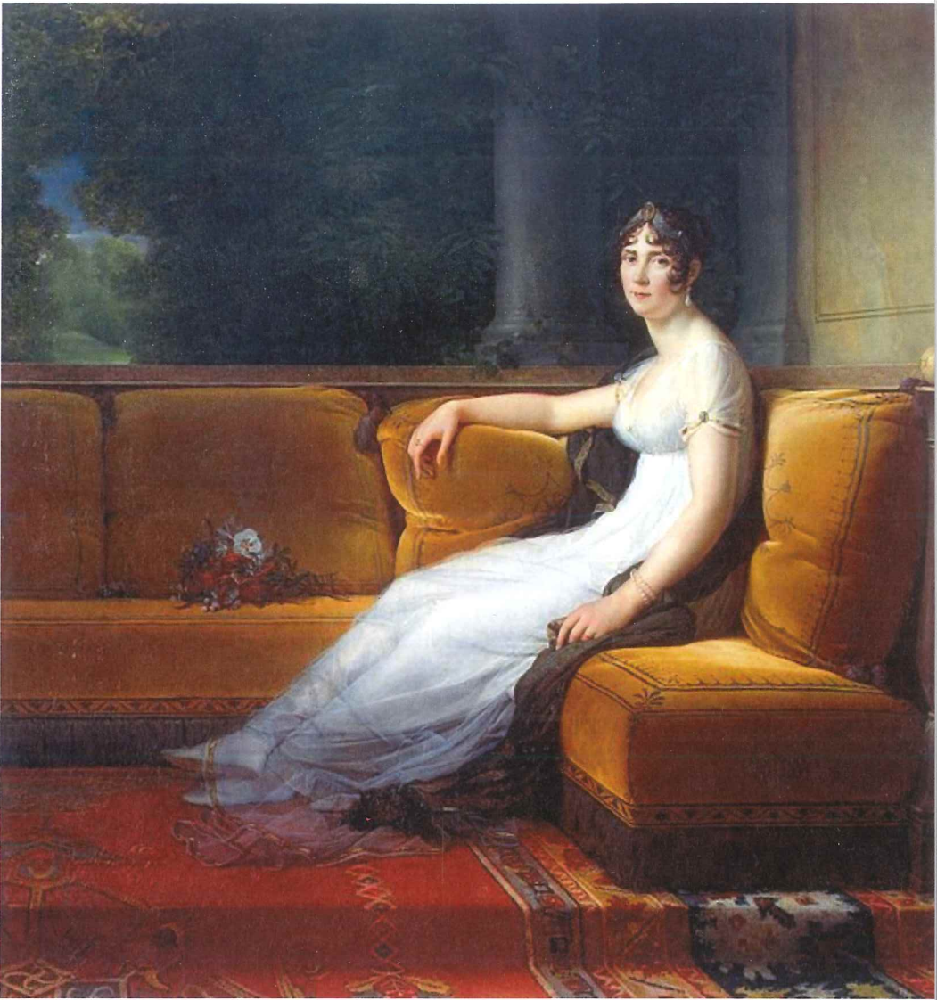
Abb. 3: Francois Gerard, Josephine, 1801, St. Petersburg, Eremitage.