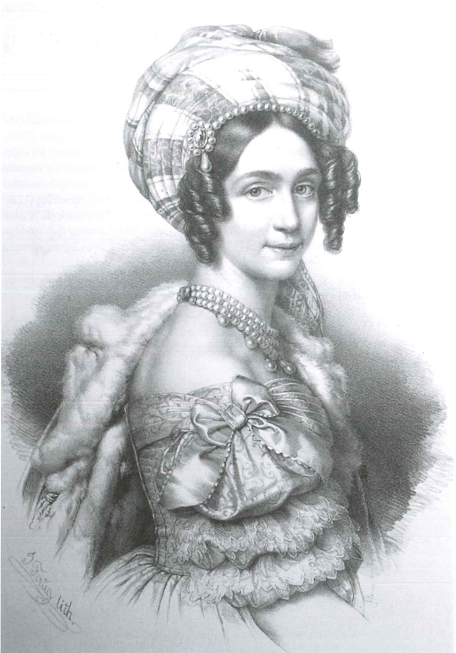
Abb. 11: Lithographie mit Porträt von Auguste Amalia.