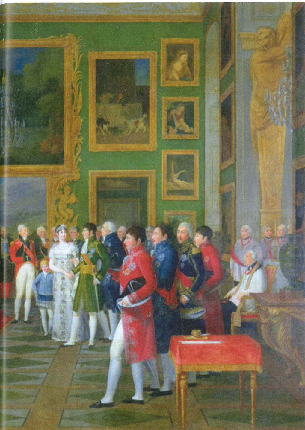
Abb. 7: Francois Guillaume Menageot, Ziviltrauung 1806, Versailles, Trianon. Von Napoleon für die Galerie de Diane in den Tuileries bestellt