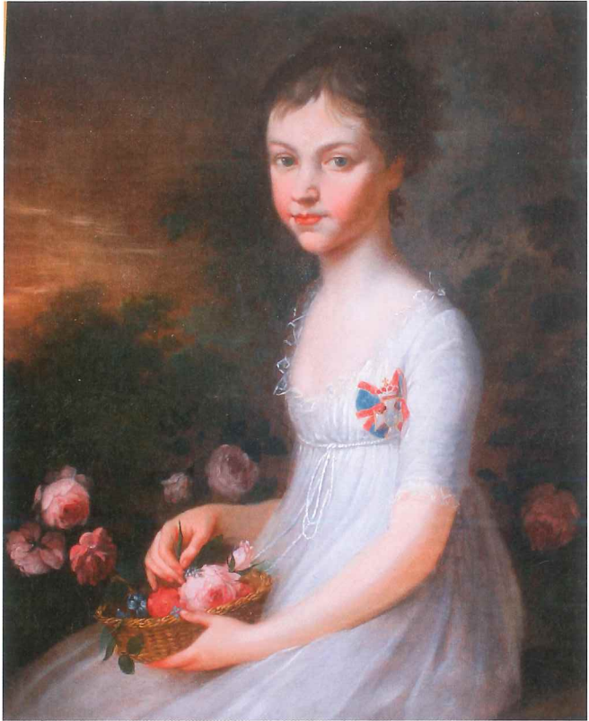
Abb. 6. Foto: Stadt Neuburg Amt für Kul- tur und Tourismus Kathrin Jacobs Residenzstraße A 66, 86633 Neuburg