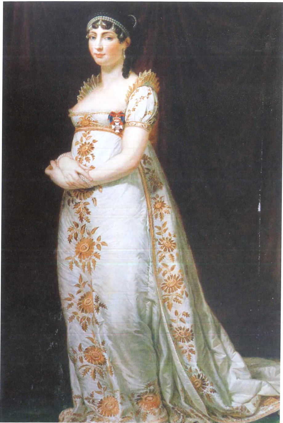
Abb. 8: Abb.8 Andrea Appiani, Auguste Amalie im Hofkleid, 1806, Privatbesitz.