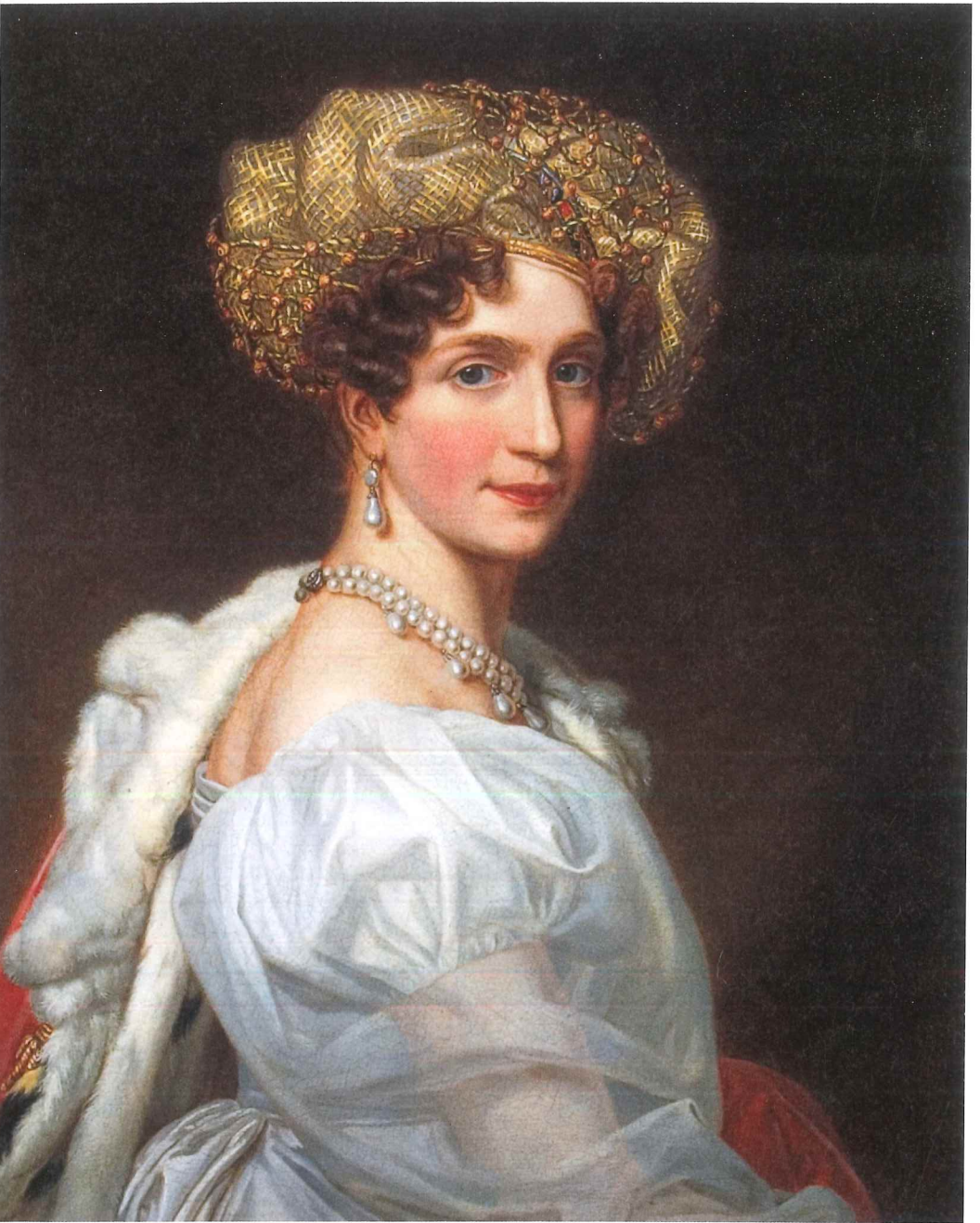
Abb. 10: Josef Karl Stieler, Auguste Amalia, Malmaison, 1824-25.