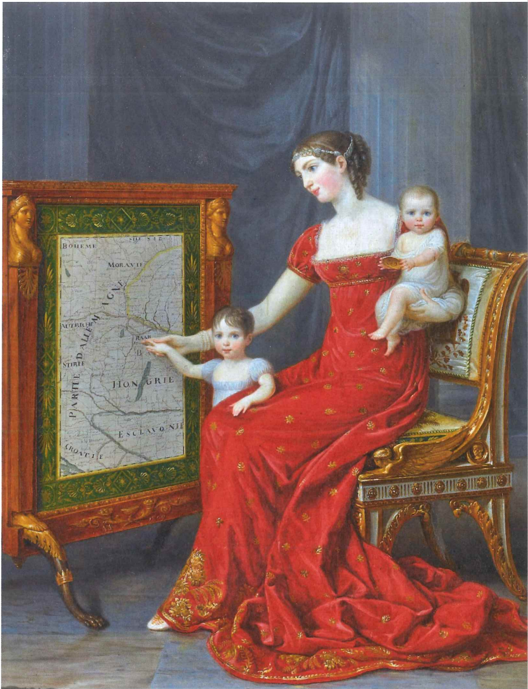
Abb. 9: Andrea Appiani, Auguste Amalie mit Josephine und Eugénie vor der Karte mit Raab , 1809, Sammlung Georg Schäfer, Schweinfurt.