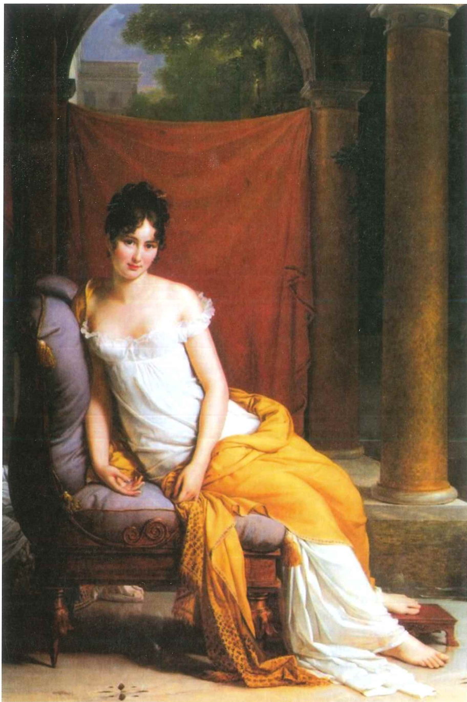
Abb. 2: François Gérard, Madame Recamier , 1805, Paris, Musée Carnavalet