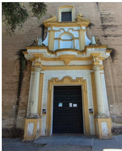
Abbildung 6: Portal der Iglesia de San Hermenegildo (16. Jh.)