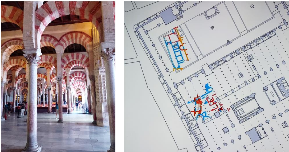
Abbildung 5: Das Innere der Mezquita-Catedral de Córdoba sowie die Ergebnisse der Grabungen; als Hinweis auf einen episkopalen Komplex gelten u. a. die Apsidenbauten.

Besichtigt wurden folgende Orte: (Córdoba): Mezquita-Catedral de Córdoba, Puente Romano, Templo Romano, Jardines Huerto de Orive (Circus), Museo Arqueológico de Córdoba ; (Sevilla): Catedral de Sevilla, Iglesia de San Hermenegildo, Monasterio de San Isidoro del Campo, Conjunto Arqueológico de Itálica , Museo Cotidiana Vitae .