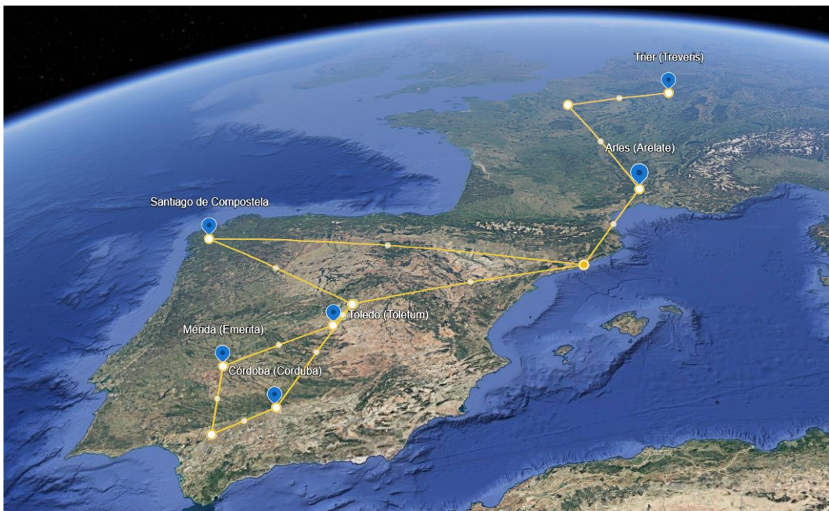
Abbildung 14: Reiseverlauf