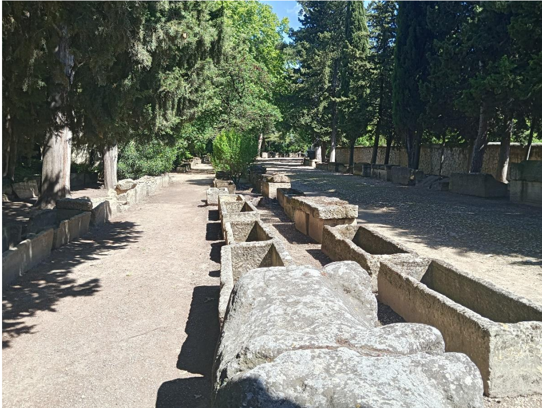
Abbildung 4: Römische Sarkophage auf dem Alyscamps.

Besichtigt wurden folgende Orte: Amphitheater, Theater, Circus, Grabung l'Enclos Saint-Césaire, Tour des Mourgues, Alyscamps, Thermes de Constantin, Basilika im Hôtel d'Arlatan, Cryptoportiques (Forum), die Basiliken Saint-Trophime und Saint-Blaise sowie die Museen Musée départemental Arles antique und Museon Arlaten .