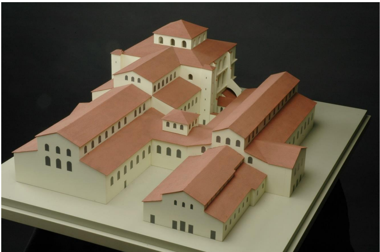
Abbildung 1: Modell der spätantiken Kirchenanlage in Trier (4. Jh.) im Museum am Dom.

Die Auswahl der Reiseziele orientierte sich an dem Ziel, eine möglichst tragfähige Vergleichsbasis zu schaffen. Die ausgewählten Städte sollten bedeutende christliche Zentren sowie nach Möglichkeit Metropolitansitze gewesen sein. Zudem mussten sie einen vergleichsweise guten spätantiken archäologischen Befund aufweisen oder Orte sein, an denen frühchristliche Märtyrerkulte nachweisbar sind. Ebenso wurde darauf geachtet, dass literarische Quellen, etwa in Form hagiographischer Texte, zu diesen Städten überliefert sind. Die Reise nahm ihren Ausgangspunkt in Trier (Treveris, Augusta Treverorum), jener spätantiken gallischen Metropole, die unter Konstantin dem Großen (306-337) als Kaiserresidenz ausgebaut wurde und in der zahlreiche Bauwerke für einen späteren Vergleich herangezogen werden können (Hoher Dom St. Peter zu Trier, St. Maximin, St. Paulin, Thermenanlagen, Amphitheater sowie Palastaula). Noch vor Beginn der Reise erwies sich eine Auseinandersetzung mit der christlichen Archäologie Triers als äußerst gewinnbringend. Besonders der Besuch des Museums am Dom in Trier war für das Verständnis des spätantiken Kirchenkomplexes (Abb. 1), der zu den größten ihrer Zeit (um 330 n. Chr.) zählt, von großem Nutzen.