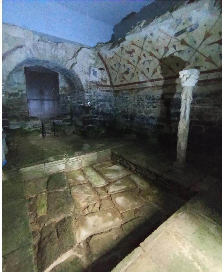
Abbildung 13: Ein exklusiver Blick in die Santa Eulalia de Bóveda.