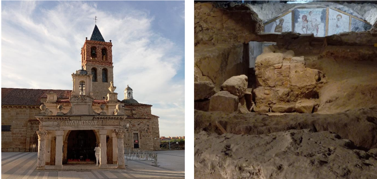
Abbildung 7: Die heutige Basilika Santa Eulalia mit dem Oratorium „Hornito“, das aus Spolien des 2. Jahrhunderts besteht, sowie die darunterliegende Grabungsstätte mit der Eulalia-Krypta im Hintergrund.