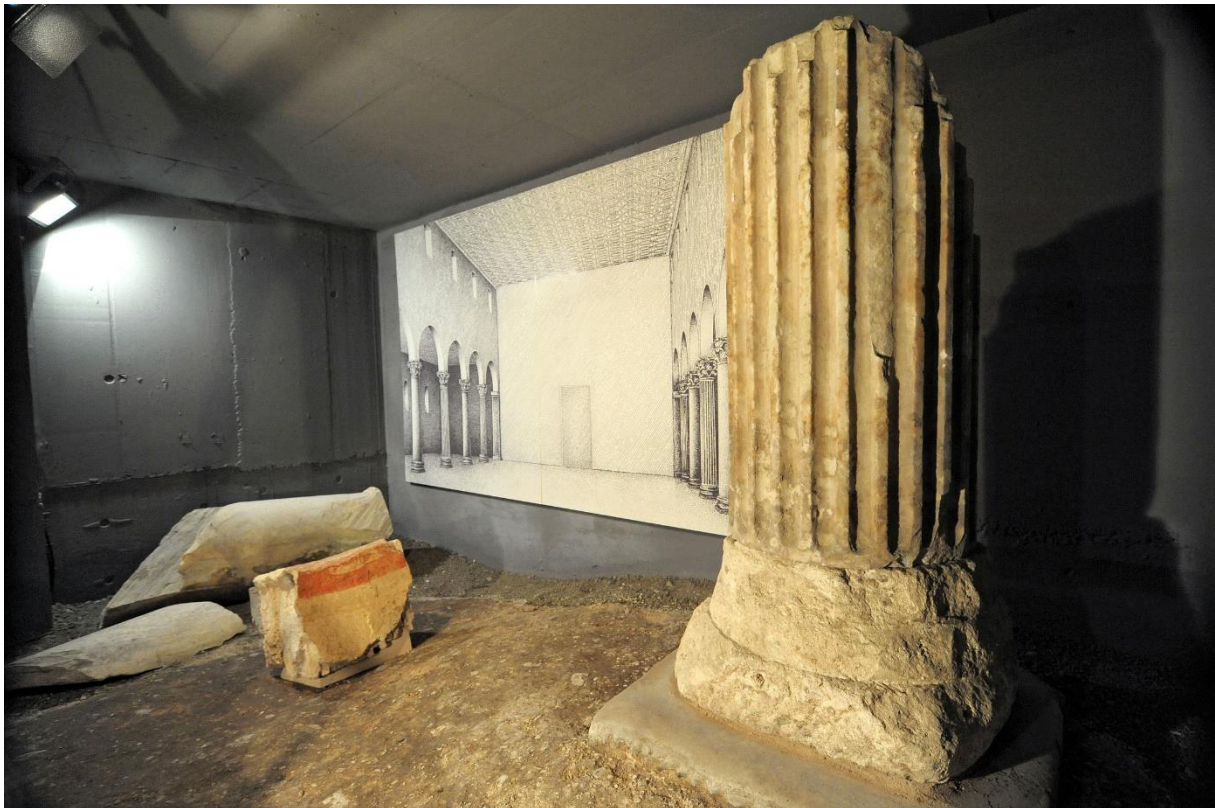
Abbildung 2: Ausgrabung unter der Domininformation in Trier.