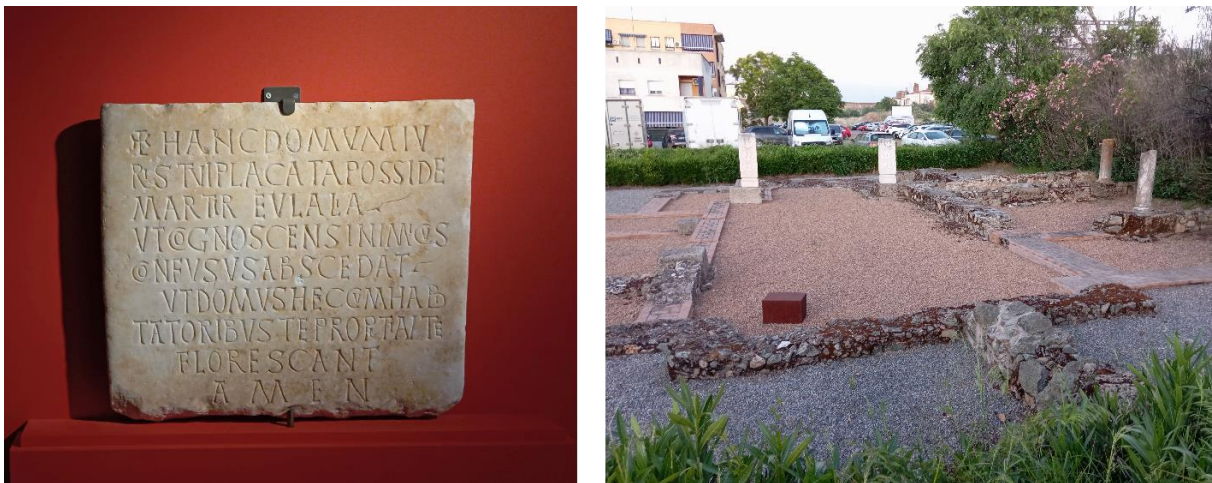
Abbildungen 8 und 9: Links die Inschrift (7. Jh., CE00489) aus dem Museo Nacional de Arte Romano, die auf ein mögliches Kloster an der Santa Eulalia verweist: + HANC DOMVM IV/RIS TVI PLACATA POSSIDE/ MARTIR EVLALIA/ UT COGNOSCENS INIMICVS/ CONFUSVS ABSCEDAT/VT DOMVS HEC CVM HABITATORIBVS TE PROPITIANTE/ FLORESCANT/ AMEN; rechts das Xenodochium des Masona (siehe: VSPE 5, 3.) (?).