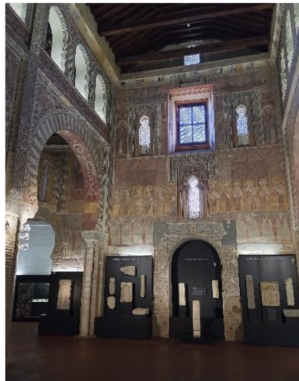
Abbildungen 10 und 11: Links eine westgotische Weihekrone (Guarrazar, 7. Jh.) aus dem Museo Arqueológico Nacional; rechts Malereien aus der Iglesia de San Román in Toledo.

Besichtigt wurden folgende Orte: (Madrid) Museo Arqueológico Nacional; (Toledo) Catedral de Toledo, Basílica de Santo Tomé, Basílica de Santa Leocadia, Termas Romanas, Circo Romano, Alcázar, Ausgrabungen Vega Baja, Museo de los Concilios y de la Cultura Visigoda.