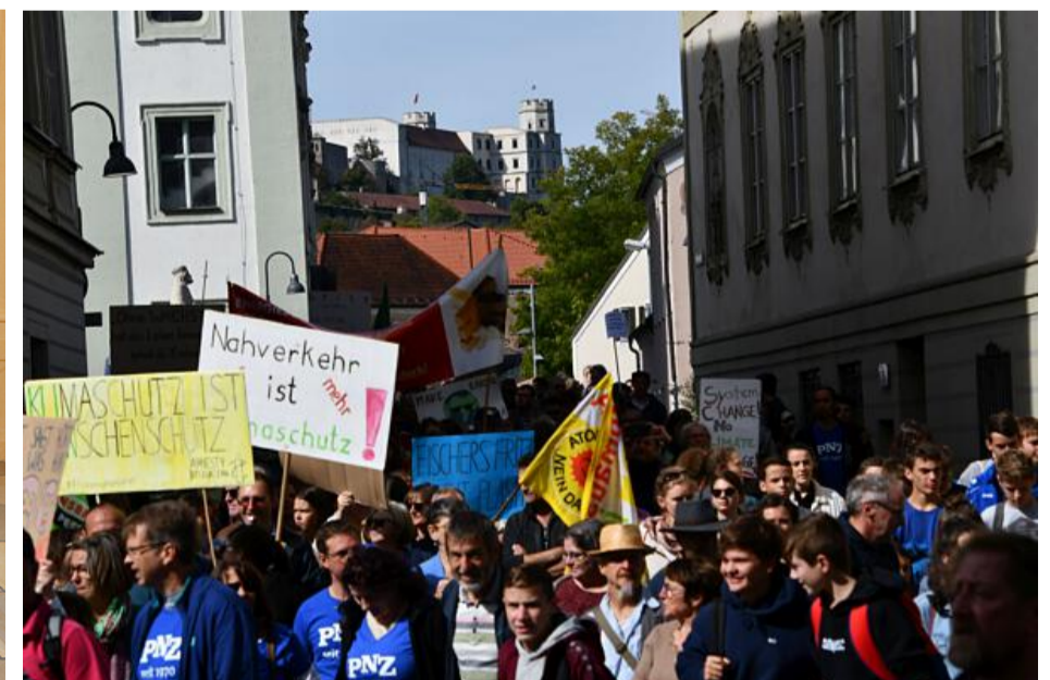
Abb. 4: Globaler Streik am 20. September in Eichstätt