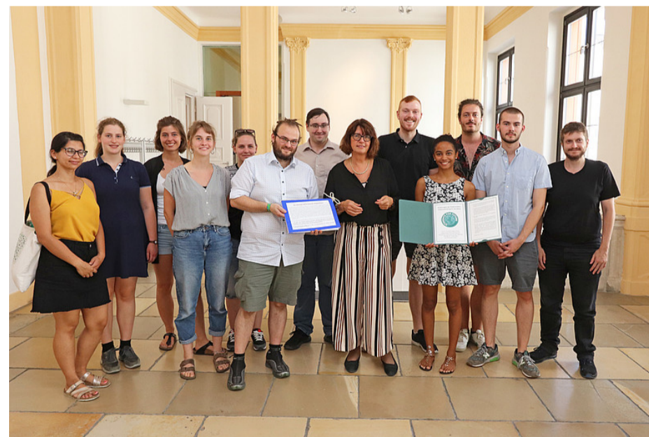
Abb. 3: Forderungen an die Universität wurden anschließend an die Universitätspräsidentin weitergereicht.