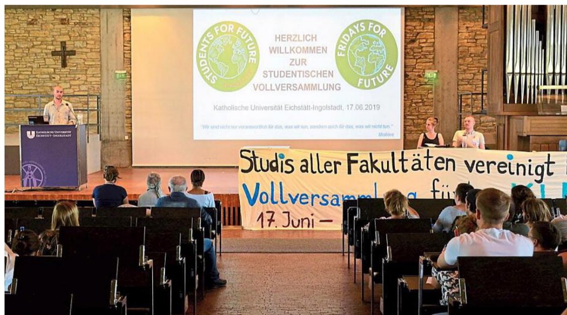
Abb. 2: Am 17.06.2019 wurde innerhalb einer eigens dafür einberufenen studentischen Vollversammlung zum Thema Klima über 5 Forderungen an die Universität abgestimmt.

An „Fridays for Future“ gefällt mir vor allem, dass diese Bewegung global und lokal in Metropolen als auch in Kleinstädten wie Eichstätt agiert. Es können alle mitmachen! Zuletzt haben in Eichstätt deutlich über 500 Menschen für den internationalen Klimastreik ihre Arbeit niedergelegt, um auf die Straße zu gehen. An der KU versucht „Students for Future“ das Thema an die Uni heranzutragen und „Scientist for Future“ geben dafür die wissenschaftliche Rückendeckung.