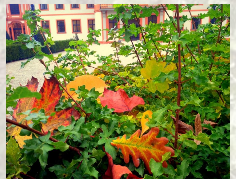
Fig. 4: Der Hofgarten erstrahlt in bunter Pracht

Eine alternative Theorie, die sogenannte „Signal-Theorie“ , formuliert von William Hamilton (2001) besagt, dass sich die Blätter eines Baums rot färben, um sie vor Insekten zu schützen, welche im Herbst ihre Eier darauf ablegen. Beispielsweise zeigten sich Blattläuse den kräftig leuchtenden Blättern eher abgeneigt. Je röter der Baum, desto stressresistenter ist er, da die Rotfärbung mit der Bildung von Abwehrstoffen einhergeht