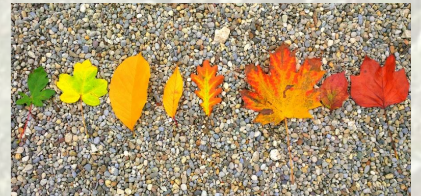
Fig. 3: Von Grün bis Rot: In allen Farben erstrahlen die Blätter im Herbst

Im Herbst, wenn die Tageslänge kürzer wird, die nächtlichen Temperaturen tiefer und die Bodenfeuchte geringer, wird Chlorophyll in den Blättern zerlegt , damit diese Bestandteile sowie weitere Nähstoffe von den Blättern in dickere Äste und den Stamm zurücktransportiert werden können. Damit kann das Blatt getrost im weiteren Verlauf abfallen, um in der kalten Jahreszeit die Verdunstung über die Blattoberfläche einzustellen.