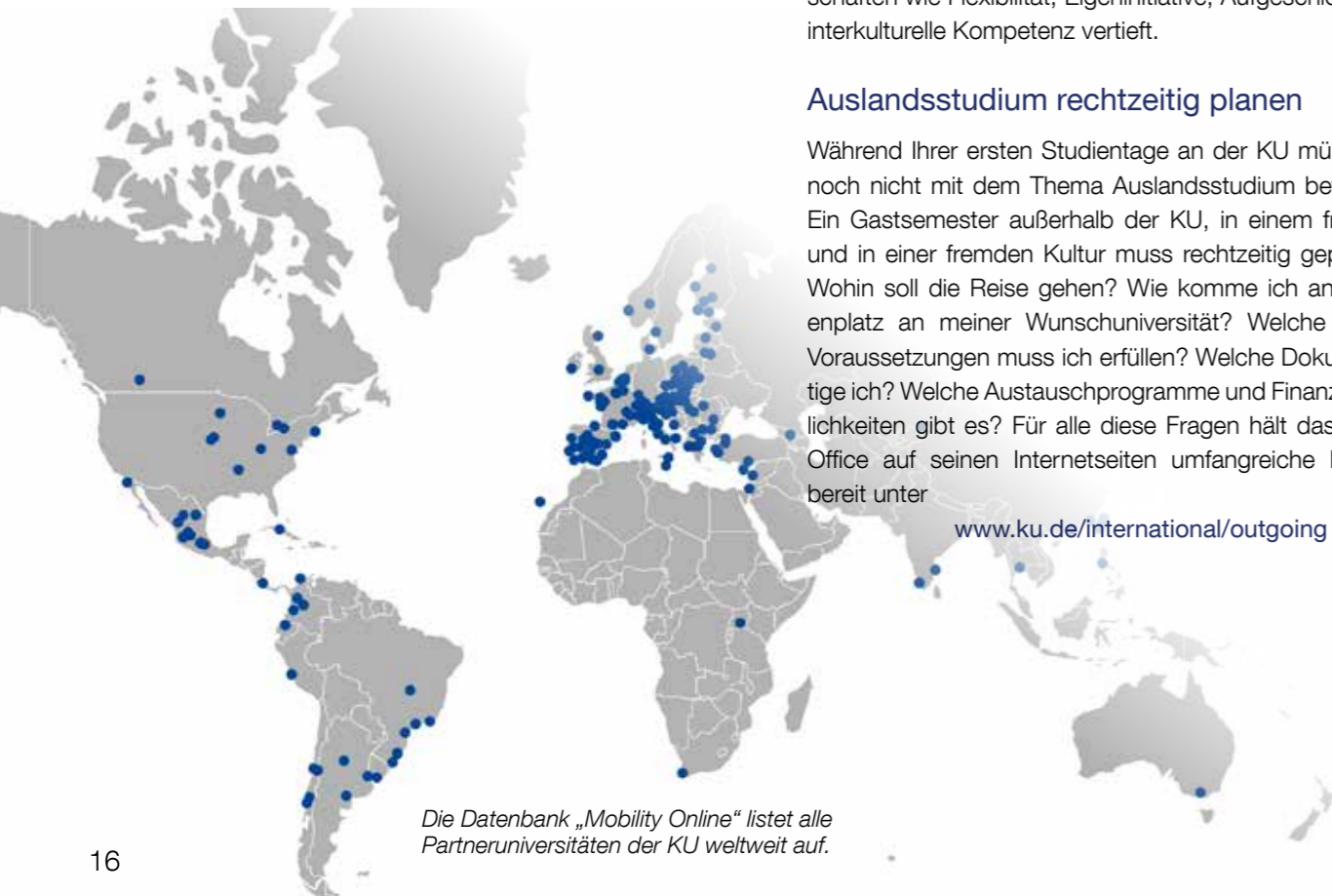
Die Datenbank „Mobility Online“ listet alle Partneruniversitäten der KU weltweit auf.