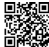
„geteduroam“ App für iOS