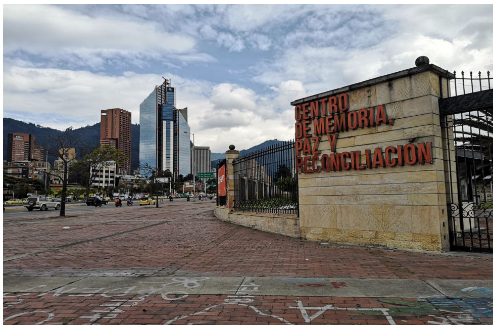
Foto 10: El Centro de Memoria, Paz y Reconciliación en Bogotá. El grafiti en el suelo pidiendo la investigación de delitos, fue pintado durante el paro nacional de 2021 y las manifestaciones del Día Internacional de la Mujer (8 de marzo).

emocionantes, como la caminata de 5 días a Ciudad Perdida, un sitio sagrado de la población indígena Tayrona, el trabajo en una Finca cafetalera y caminatas a las cascadas en Antioquia. Por supuesto que disfrutamos de las diversas facetas del área, pero como estudiantes en el campo de los estudios de paz y conflicto nuestra perspectiva está formada en el sentido de que para nosotros la presencia del conflicto armado más largo de América Latina no puede pasarse por alto y es omnipresente.