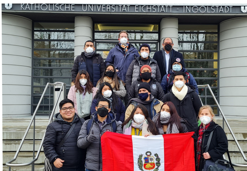
Foto 17: Estudiantes de la UNMSM de Perú en el campus WFI en Ingolstadt.