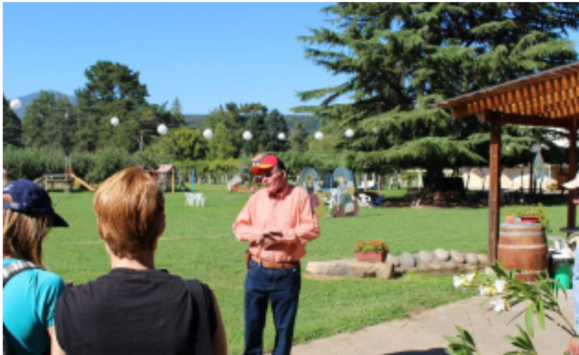
Foto 4: Alumnos de la KU Eichstätt-Ingolstadt visitando Villa Baviera, la antigua „Colonia Dignidad“. Como parte de una excursión en 2018, los estudiantes pudieron estar en contacto con testigos contemporáneos en el lugar. (Miriam Blaimer)

sita surgió la idea de profundizar en el tema de “Colonia Dignidad” en el marco de un seminario y una conferencia internacional de especialistas.