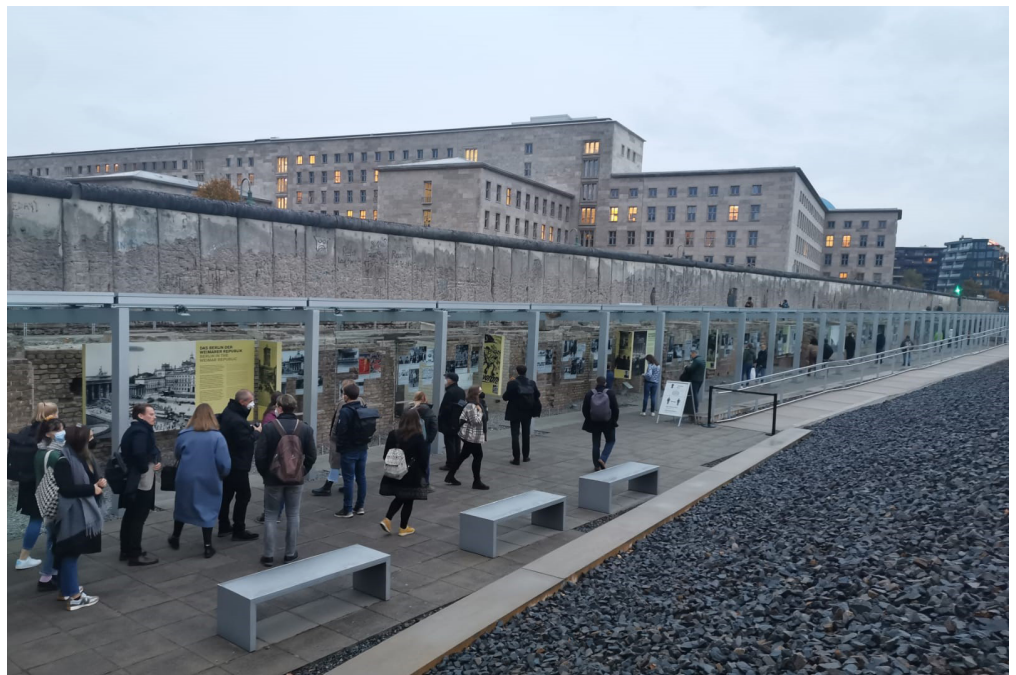
Abb. 14: Studierende des Seminars „Lernort Hauptstadt“ beim Besuch des Erinnerungsortes „Topographie des Terrors“. (Leitung der Exkursion)