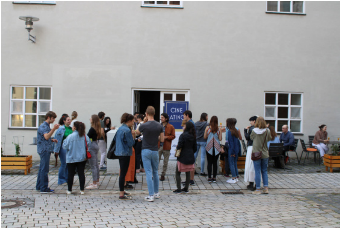
Abb. 18: Die Gäste der 11. Lateinamerikanischen Filmtage beim Sektempfang vor dem Kino im alten Stadttheater Eichstätt. (Sarah Döbbener)