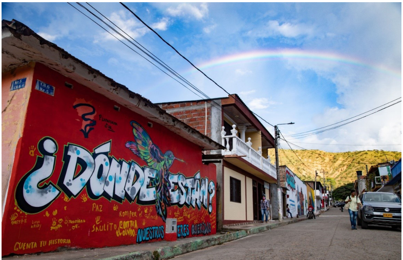
Abb. 11 und 12: Murals im süd-kolumbianischen Bundesstaat Huila, betitelt „Colombia“ und „¿Dónde Están?“ (Victor Ordaz Gerritz)