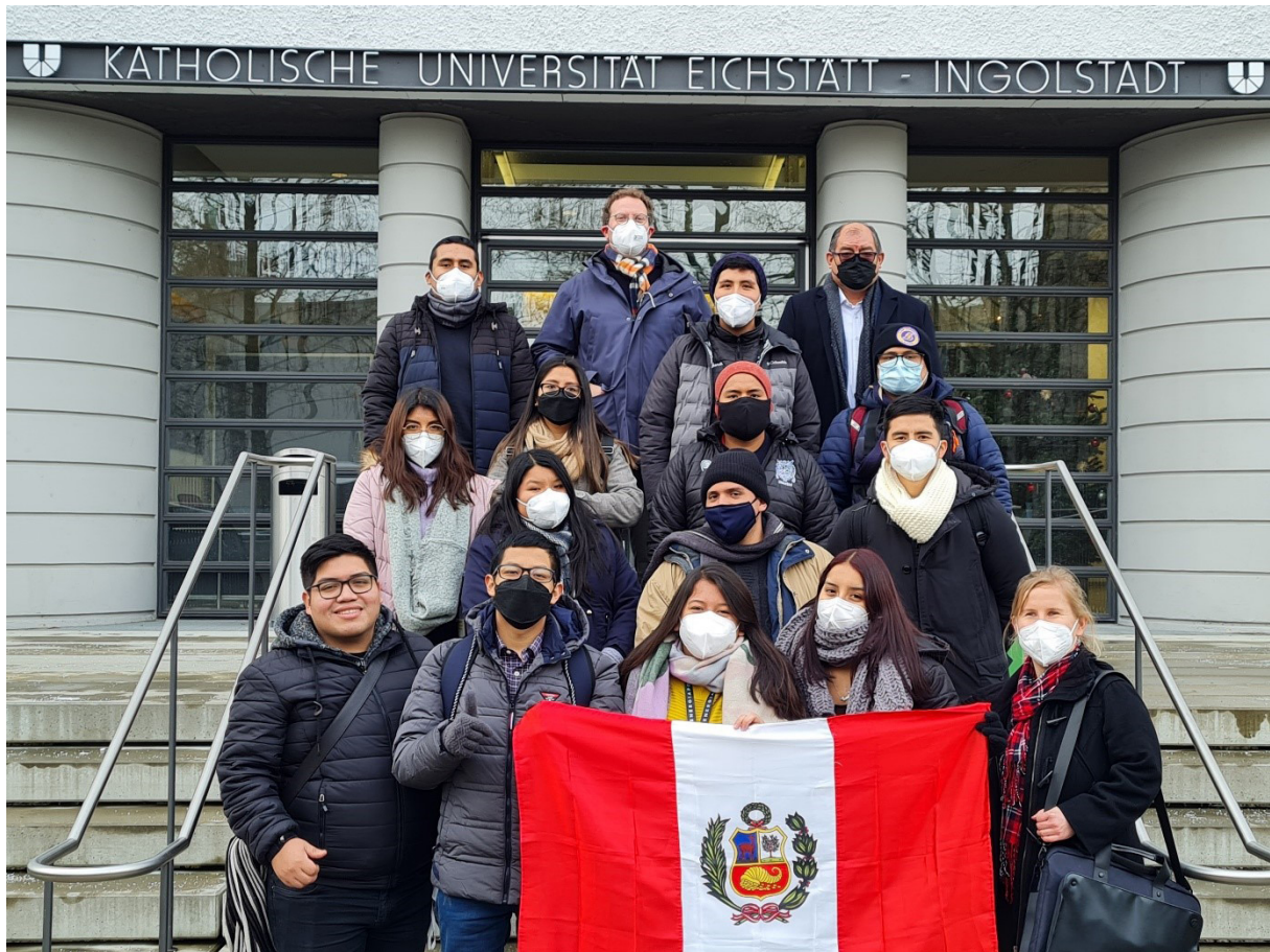
Abb. 17: Studierende der UNMSM am Campus der WFI in Ingolstadt.