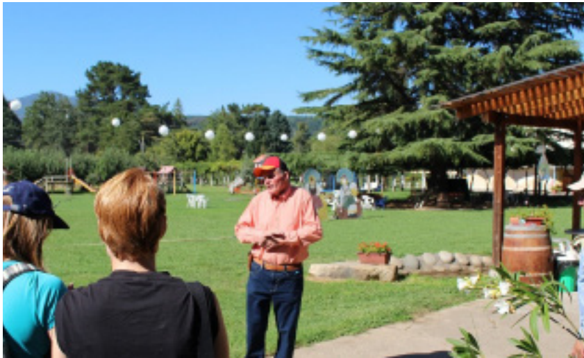
Abb. 4: Studierende der KU Eichstätt-Ingolstadt zu Besuch in der Villa Baviera, der ehemaligen „Colonia Dignidad“. Im Rahmen einer Exkursion 2018 konnten die Studierenden mit Zeitzeugen vor Ort in Kontakt treten.