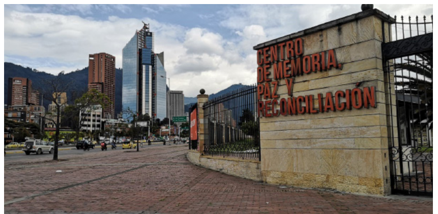
Abb. 10: Das Centro de Memoria, Paz y Reconciliación in Bogotá. Auf dem Boden Graffiti, die zur Aufklärung von Verbrechen aufrufen und während des Nationalstreiks 2021 und den Demonstrationen am Internationalen Tag der Frau (8. März) entstanden sind.

Bei einer mehrtägigen Exkursion in ein Dorf von Firmantes de Paz (Unterzeichnende des 2016 zwi-