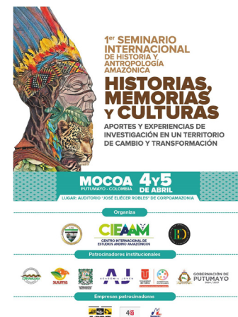
Anuncio de la conferencia sobre la Amazonia en Mocoa

La participación fue numerosa: además de los investigadores invitados y locales, asistieron numerosas personas con formación en didáctica, profesores, dirigentes de organizaciones sociales, miembros de las autoridades y de la iglesia, así como alumnos. Los debates sobre las contribuciones individuales se desarrollaron en consecuencia: La atención se centró en la aplicación de las conclusiones y tesis