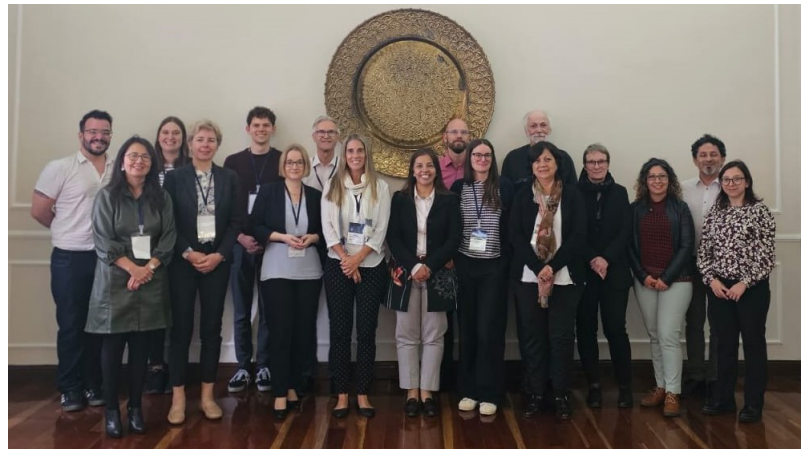
Participantes en la conferencia

primer panel del segundo día, en el que se debatieron diversos aspectos del abordaje del pasado en Colombia, entre ellos el papel de los movimientos sociales en el trabajo de memoria, el reconocimiento de responsabilidad colectiva por parte de los ex miembros de las FARC en el proceso del esclarecimiento de la verdad, la importancia de la construcción de la masculinidad para el éxito del proceso de paz y los vínculos entre la cooperación