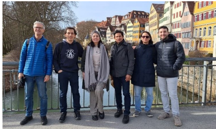
Doctorandos en el Eberhardsbrücke en Tubinga.