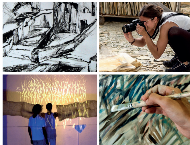
Grafik | Malerei | Drucktechniken | Dreidimensionales Gestalten | Umwelt- und Produktgestaltung | Fotografie | Digitale Medien | Theater | Performance | Tanz | Mixed Media