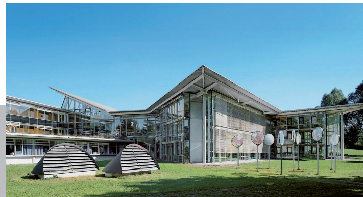
Stand: Januar 2025