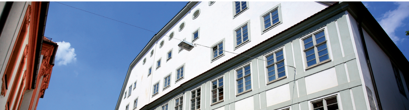
Stand: April 2025