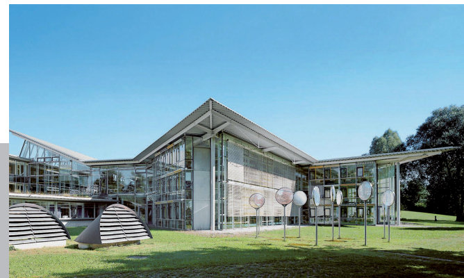
Stand: Januar 2025

www.facebook.com/uni.eichstaett www.instagram.com/uni.eichstaett