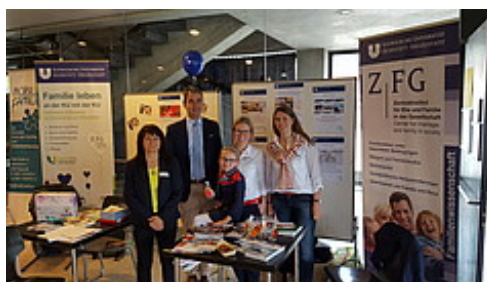
Tag der offenen Türe an der KU