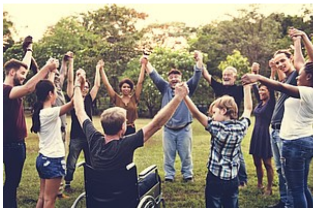
Informationen zum Cluster Bürgerschaftliches Engagement