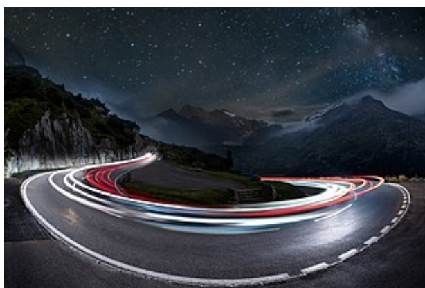
Informationen zum Cluster Innovative Mobilität