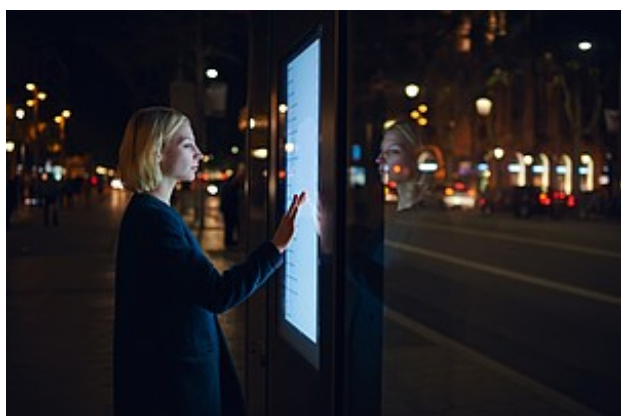
Informationen zum Cluster Digitale Transformation